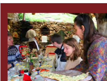
Table d'hôte auf einem Biohof:

(Änderungen vorbehalten) Fünf bis sechs Wanderungen von 2 bis max. 5 Stunden Gehzeit führen durch die wilden Granit- und Schieferberge und durch die beeindruckenden Kalksteinschluchten von Beauce und Ardèche. Bei einem Table d'hôte (Mittagessen) bei Biobauern haben wir Gelegenheit viel über die Ardèche und ihre Bewohner zu erfahren. Abends kocht Uli leckere Vier-Gang-